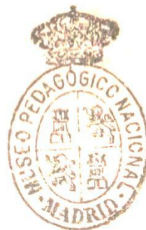
Museo Pedagógico Nacional