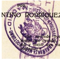
Sello del Instituto Nocturno