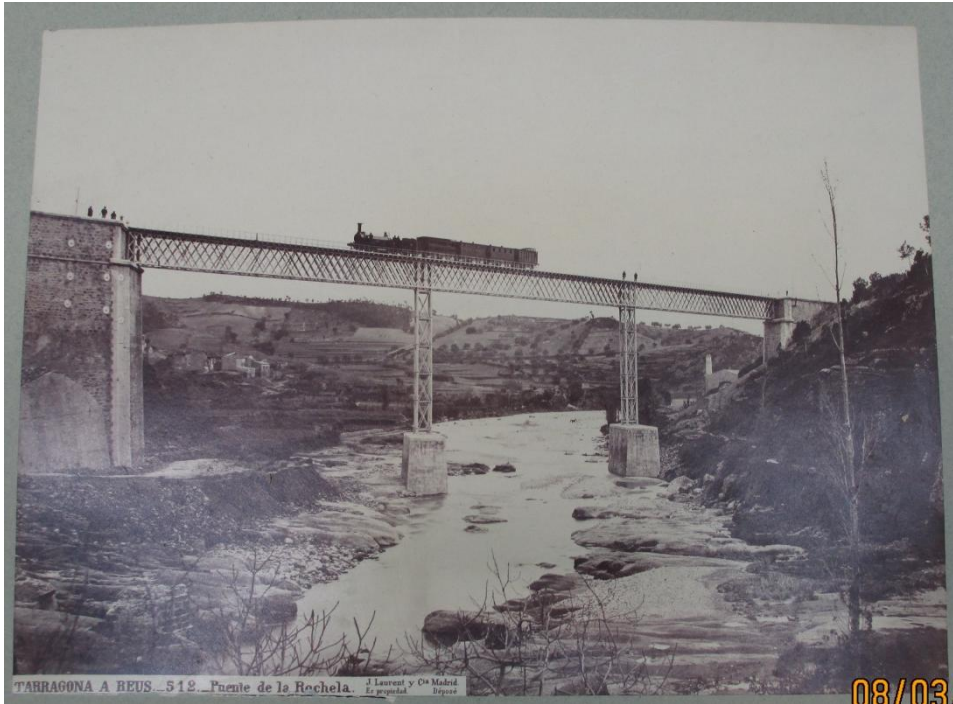
Puente de la Rochela