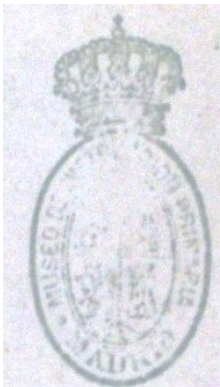
Museo de Instrucción Primaria